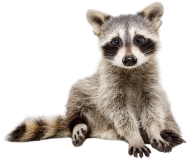
un raton laveur